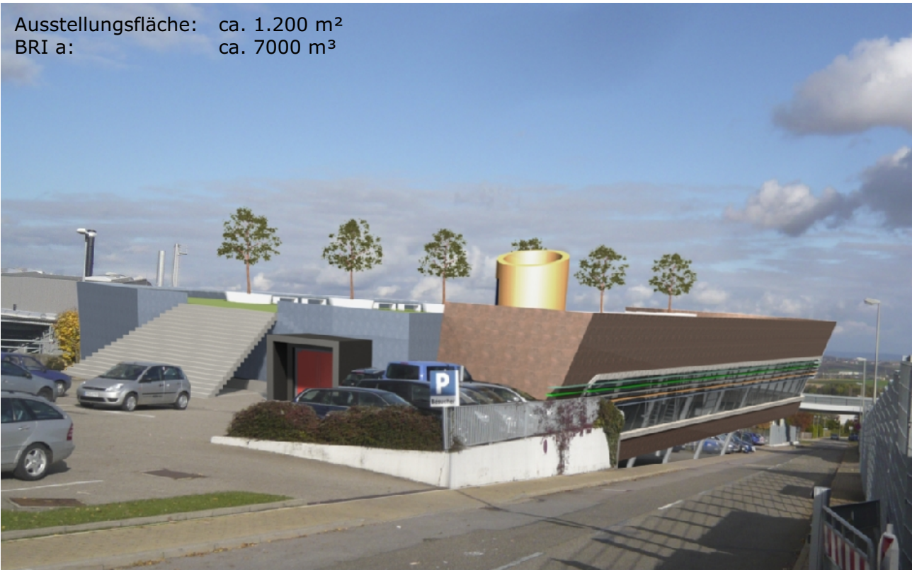
Perspektivische Darstellung, Blick Richtung Eibensbach;

Ausstellungsfläche: ca. 1.200 m 2 BRI a: ca. 7000 m 3